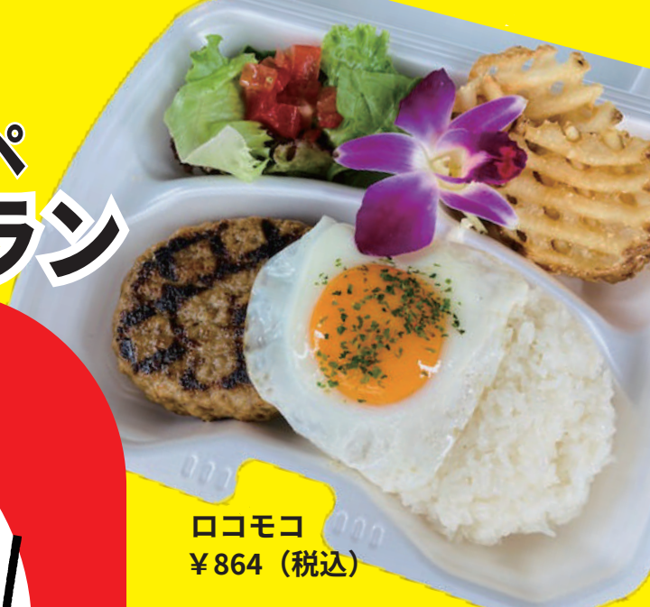
ロコモコ ¥864 (税込)