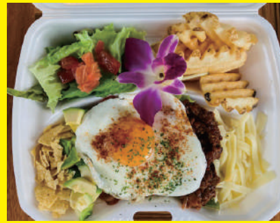
タコライス ¥864 (税込)