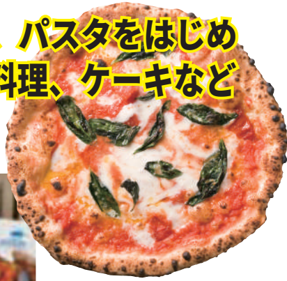
マルゲリータ ¥1,458 (税込)

窯焼きナポリピッツァ、パスタをはじめ 前菜、サラダ、魚・肉料理、ケーキなど お持ち帰りできます。