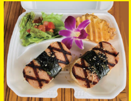
スパむすび ¥756 (税込)